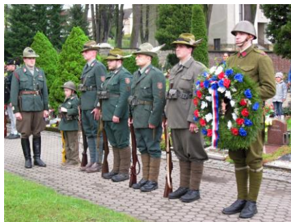
6. května 2015, Police nad Metují: členové Spolku vojenské historie T-S 20 Pláň při pietním aktu k 70. výročí konce 2. světové války v Evropě